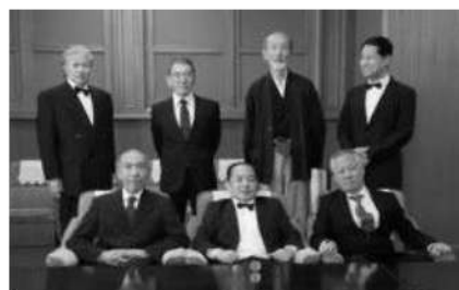
<当時の国会で全会一致で制定された。政治家や官僚、地方自治体が一体となって優生保護法を推進した。>

優生思想とは? 身体的、精神的に秀でた能力を有する者の遺伝子を保護し、逆にこれらの能力の劣っているものの遺伝子を排除して優秀な人類を後世に残そうという考え方である。障害者は能力の劣っている者とみなされ、「生きるに値しない命」とされていた。